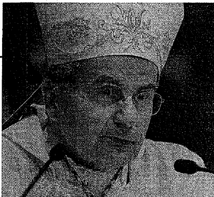
Qui sopra il cardinale Carlo Caffarra. In basso, i partecipanti al forum del «Carlino»

Ivano Dionigi: «Cos'è rimasto dell'omelia? Quella del cardinale credo sia stata una vox clamans in deserto . Non ho molta fiducia in queste uscite forti. Però ho colto due aspetti che m'interessano. Intanto il richiamo all'unità, versus l'individualismo, che è il vero cancro. Perché dobbiamo capirlo, oggi o ci si salva tutti o nessuno. L'altro punto è la speranza. Mi faccio qualche domanda: i credenti in questa città devono essere i primi a dare testimonianza? I cristiani di Bologna danno testimonianza? Condivido l'idea che ci sia un deficit di cultura pauroso, anche un deficit di cultura religiosa. I politici approvano o disapprovano, spesso fanno gli incendiari più che i pompieri, ma non hanno mai letto una pagina della Bibbia. Questo è un vulnus inaccettabile. Non so dire se Bologna sia più decaduta, di sicuro un eden non è mai esistito. Agli uomini di chiesa mi viene da dire: non siate presi dalla sindrome dell'accerchiamento».